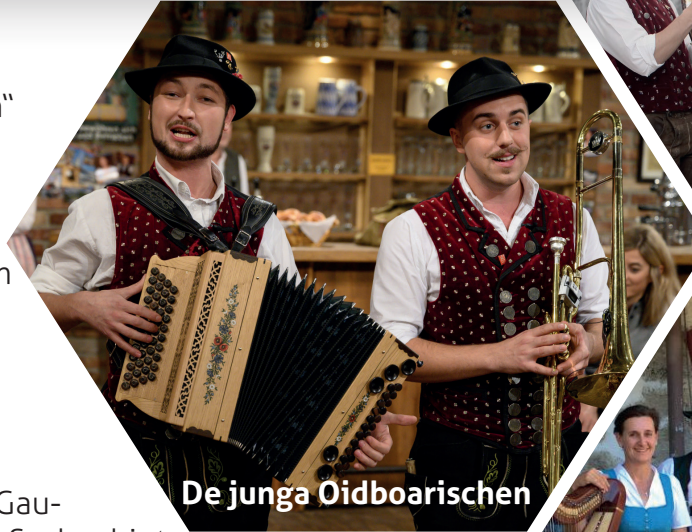
De junga Oidboarischen

bis 31. März Verkauf über Gau- vortänzer/-vorplattler oder Sachgebiet „Volkstanz und Schuhplattler“ im Bayerischen Trachtenverband ab 1. April freier Vorverkauf über Eventim Restkarten an der Abendkasse erhältlich Kartenpreis 10€