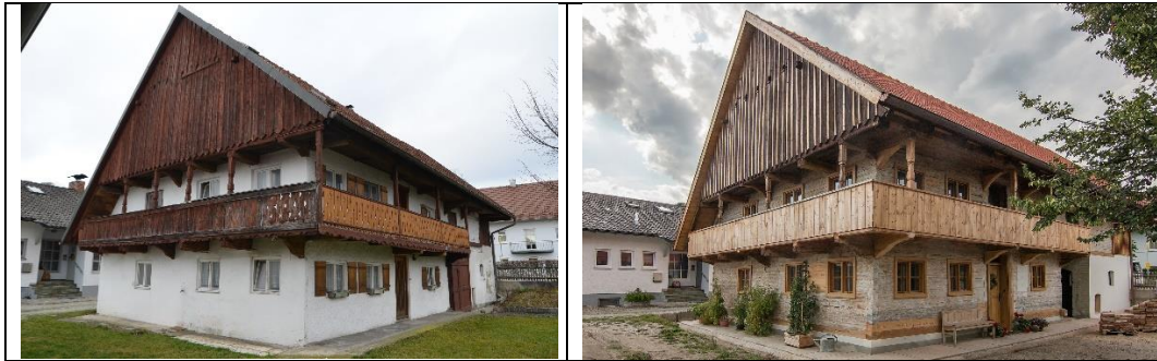
Foto1: Feil Architekten; Foto 2: ALE Niederbayern

Zuständige Behörde: Amt für Ländliche Entwicklung Niederbayern