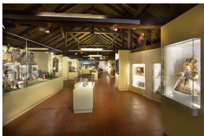
Museum Schloss Ritzen/Ebene - Krippenausstellung