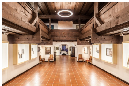
Museum Schloss Ritzen/Ebene 1 - Votivtafeln und Wallfahrt