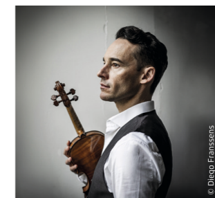
Linus Roth Violine