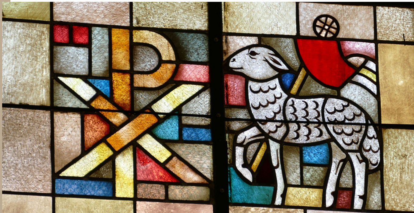
Buntglasfenster mit dem Lamm Gottes - v. a. im Christentum ist das Lamm ein beliebtes Motiv.

im Rahmen des EU-Projektes SchafOhrMarke