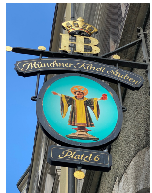
Münchner Kindl Stubn Schild

Dieser verdammte Virus lässt uns einfach nicht in Ruhe und wir mussten uns den Fakten beugen. So blieb unser Veranstaltungsraum leer, die Pressekonferenz erübrigte sich. Wie soll man in solchen Zeiten von einem großartigen Aufbruch künden?