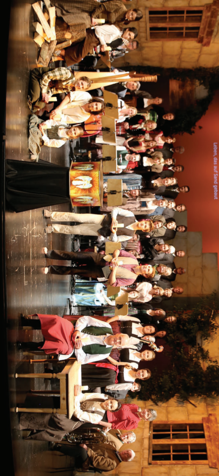
Leben, das auf Sand gebaut