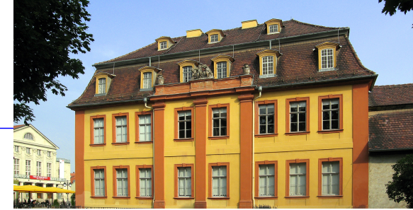
Das Wittumspalais: Sitzungsort der Landtage in Weimar bis 1848

12.00 Uhr: Diskussion — 12.30 Uhr: Mittagspause