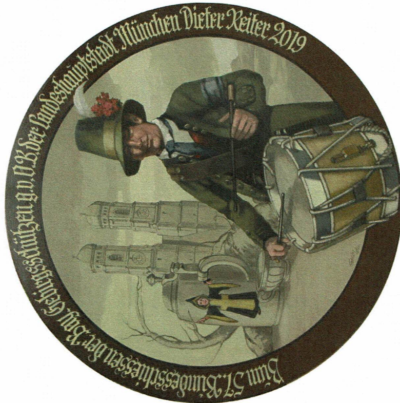
Scheiben gemalt von Günter Hein, Bad Aibling

Sonntag, 29. September 2019 um 18 Uhr im Schützenhaus in Kreuth. Es muß von jeder am Schießen teilnehmenden Kompanie mindestens ein Gebirgsschütze in Montur anwesend sein. Nicht abgeholte Preise verfallen zugunsten des Bundes der Bayerischen Gebirgsschützen-Kompanien.